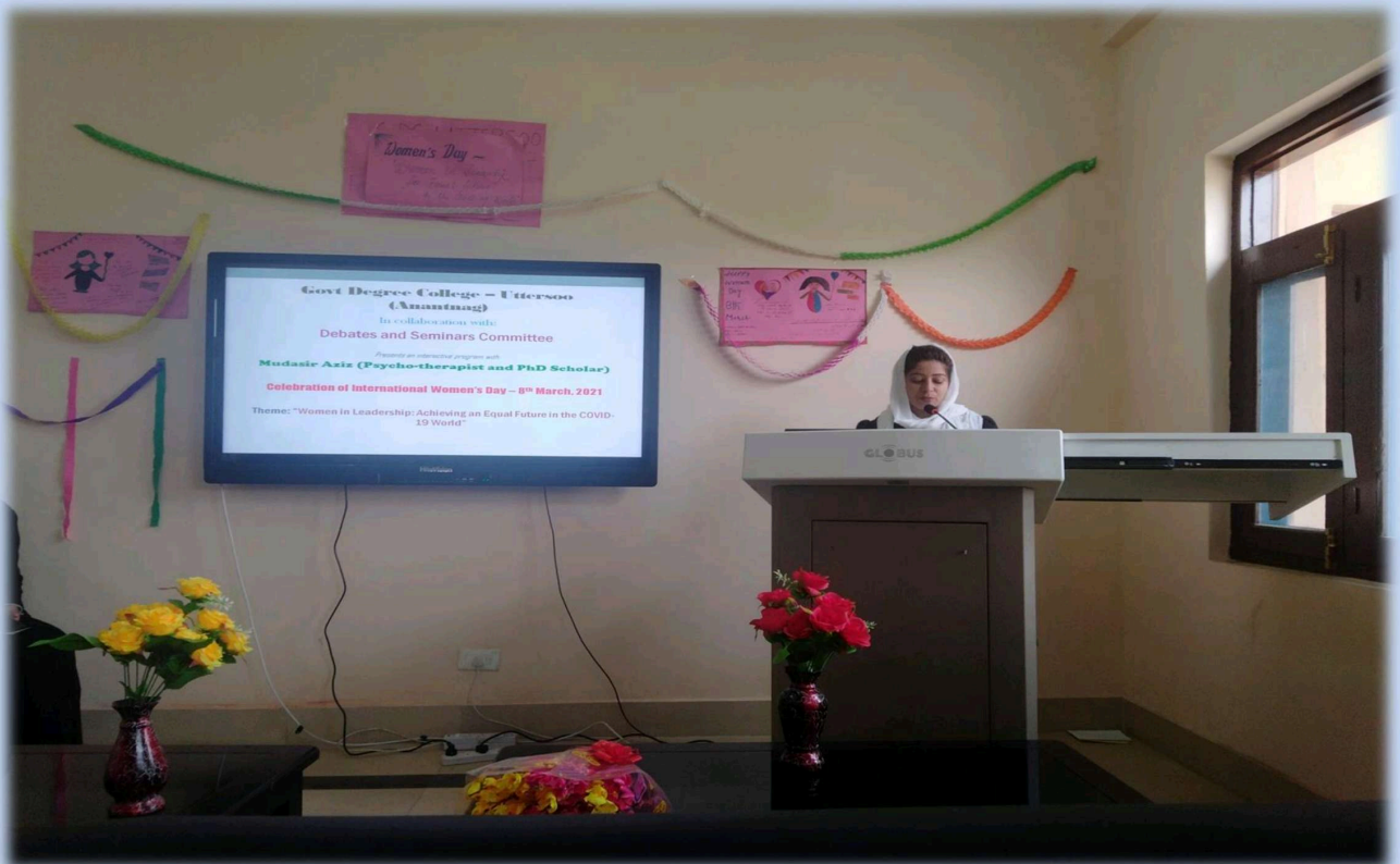
FIGURE 2: CELEBRATION OF INTERNATIONAL WOMEN DAY