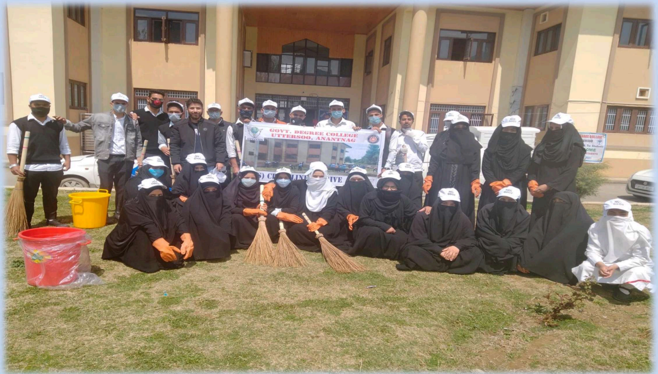
FIGURE 1: NSS UNITS ORGANIZE A CLEANLINESS DRIVE