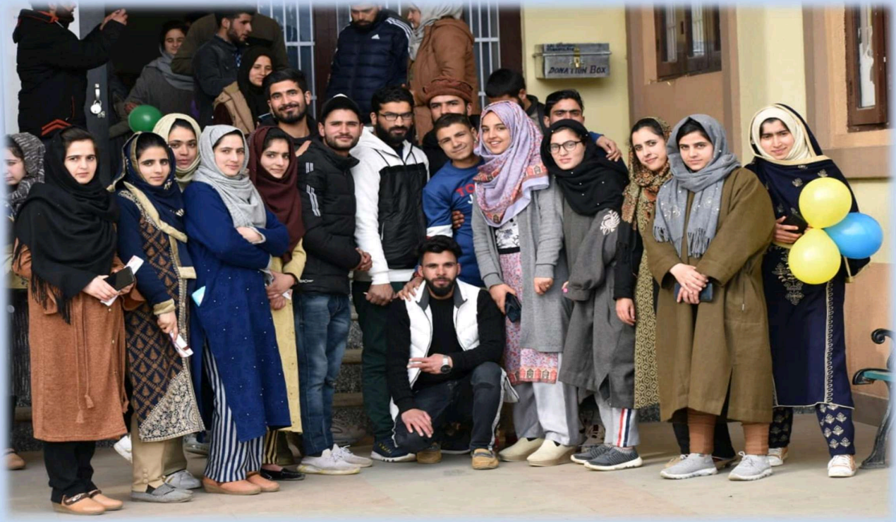
FIGURE 4: FAREWELL TO THE OUTGOING STUDENTS