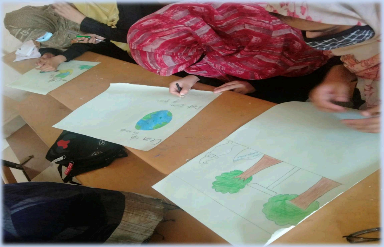
FIGURE 3: ON-SPOT DRAWING COMPETITION