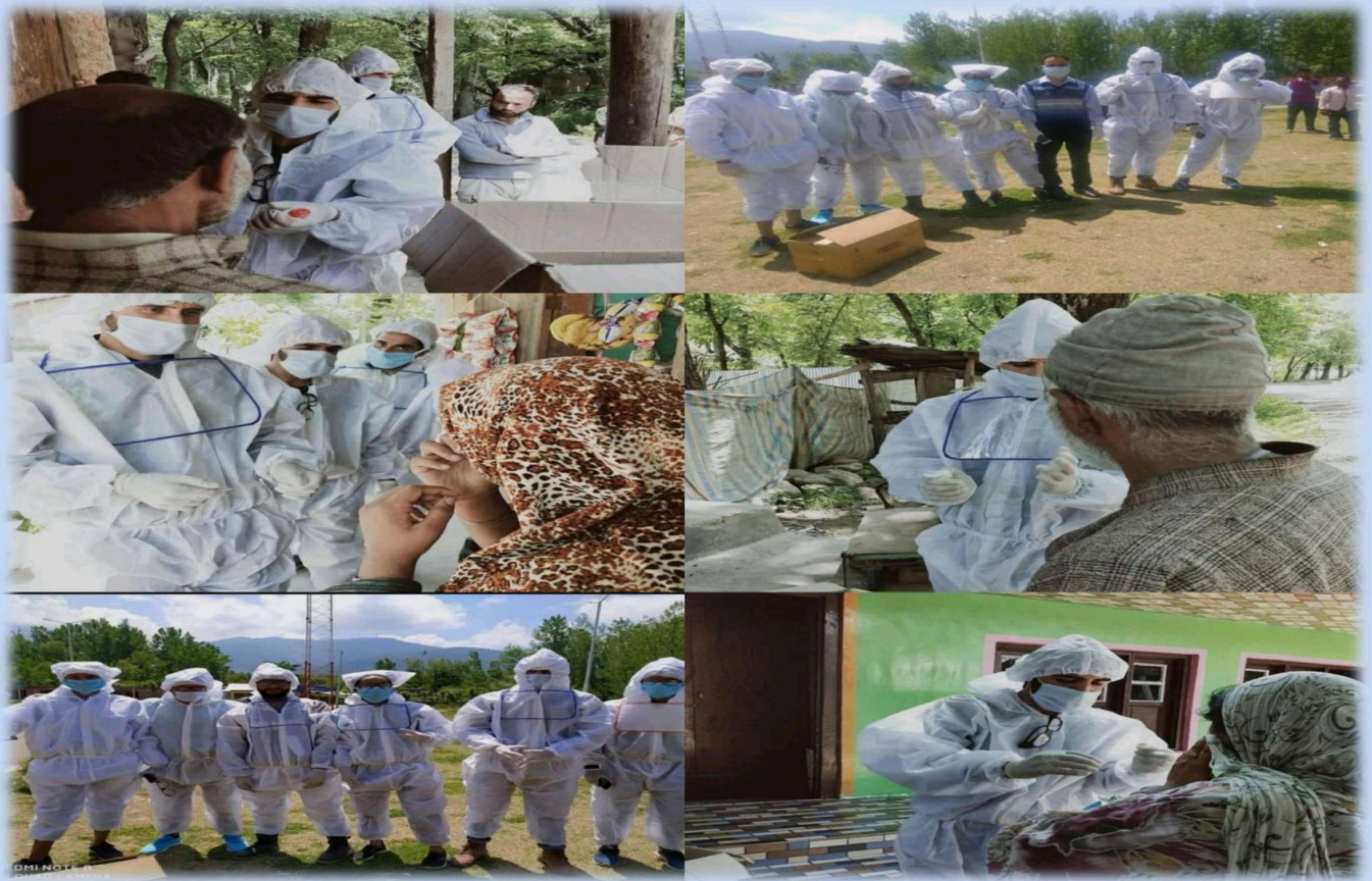
FIGURE 2: NSS UNITS OF THE COLLEGE WENT INTO THE FIELD TO SENSITIZE THE PUBLIC ABOUT COVID-19